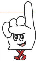
ライバルとの 競争を楽しみに 御茶ノ水に 集合です!