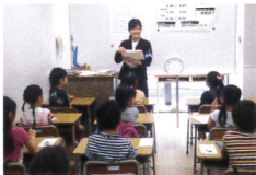
先生の説明を集中して聞き、 テストに備えます。