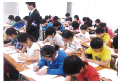
最後まで一問一問 真剣に取り組みます。